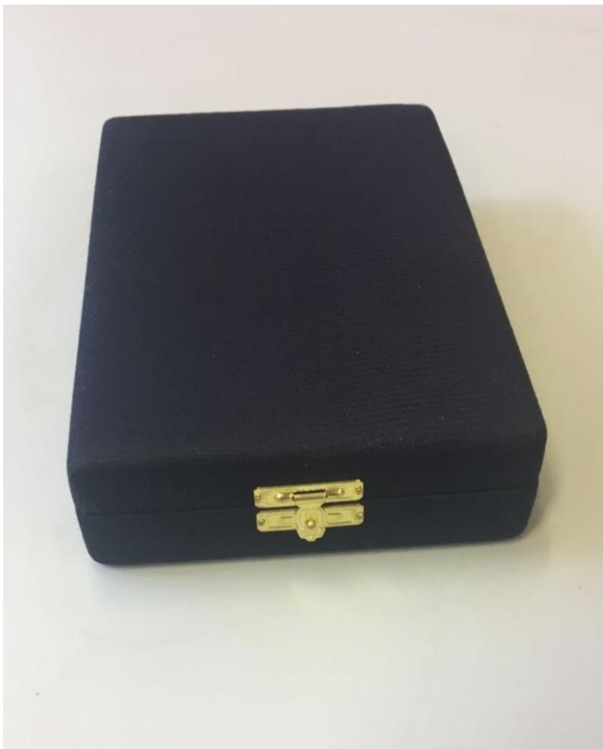
FOTO DO ESTOJO DA MEDALHA DA VITÓRIA Parte Externa e Interna (REFERENTE AO ITEM 1):